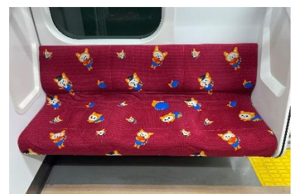
そうにゃん柄の座席シート

現在、10代目そうにゃんトレインで使用している、歴代そうにゃんがデザインされた「そうにゃん柄の座席シート」を、11代目そうにゃんトレインでも使用します(運転開始後、順次変更)。