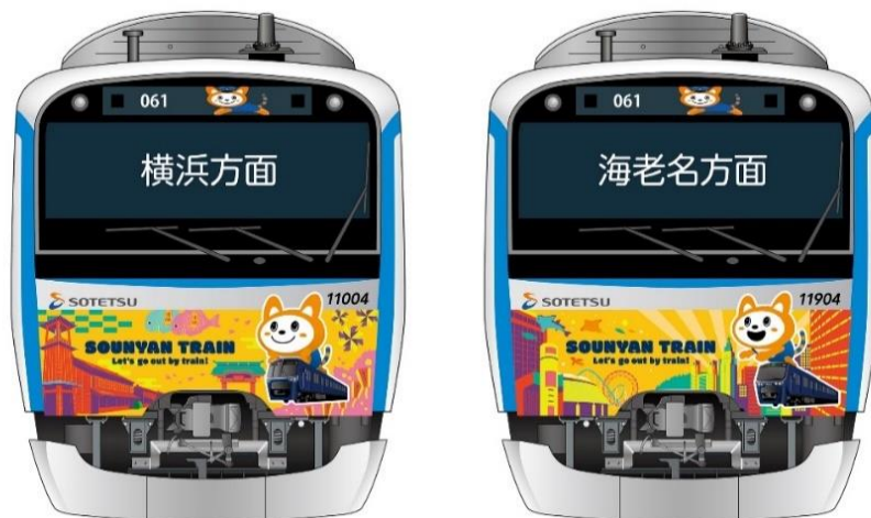
「11代目そうにゃんトレイン」車両の前面のラッピング 横浜方面（左）、海老名方面（右）（イメージ）