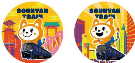
車両側面のラッピングマーク (イメージ)