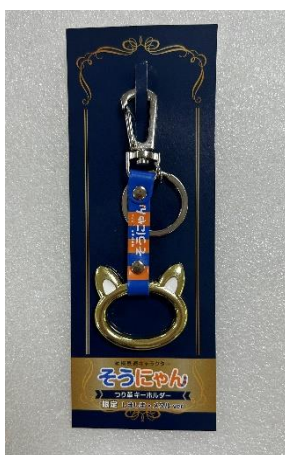
「そうにゃんつり革キーホルダー （しましま×メタル）」