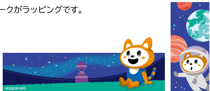
車内壁面のラッピング (イメージ)