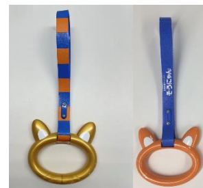
ゴールド&しっぽ柄つり革(左) 初代つり革(右)

新たに「ゴールド&しっぽ柄つり革」を設置するとともに、現在、10代目そうにゃんトレインで設置している「初代つり革」を11代目そうにゃんトレインでも使用します(1両に2本、1編成で20本)。