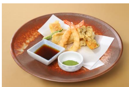
ランチメニュー(メイン:国産牛肉の紙鍋すき焼き風、ビュッフェメニュー、天ぷら盛り合わせ)