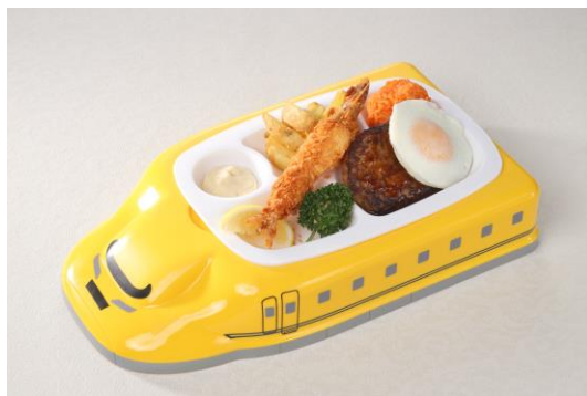
お菓子ガチャガチャコーナー、 新幹線プレート