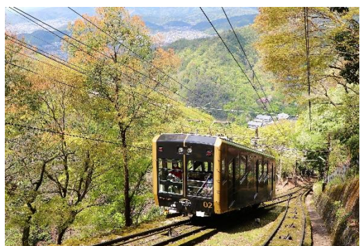
今春車体デザインを一新した叡山ケーブル