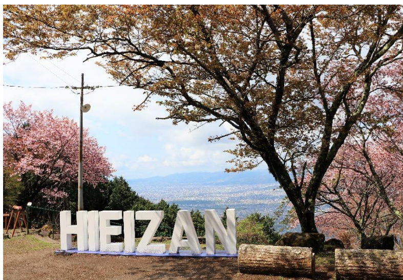
ケーブル比叡駅横の「パノラマ広場」