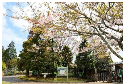
ガーデンミュージアム比叡西門と開花が始まった桜