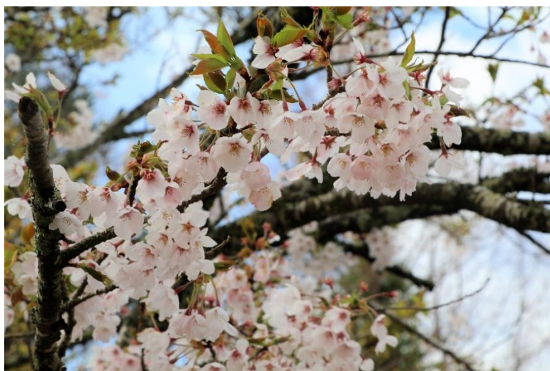
比叡山頂付近で開花が始まった桜

今年は桜の開花が早く、鑑賞できなかった方も多いと思われますが、新型コロナウイルス感染予防を続けながら、心身のリフレッシュと体力作りに、春本番を迎える比叡山の散策はいかがでしょうか。