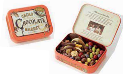
＜カカオマーケット by マリベル＞ フルーツディップ&チョコレートボール アソートレッド缶(270g)