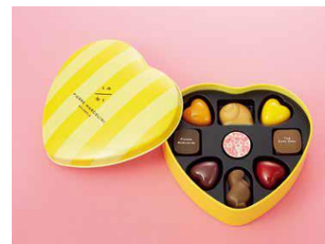
＜ピエール マルコリーニ＞ バレンタイン セレクション(9個入)