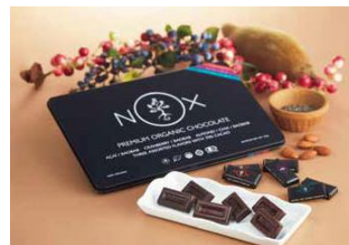
＜ノックス オーガニクス＞ プレミアムオーガニックチョコレート Mixed Edition(30個入)

見た目も個性的な、太陽と惑星をイメージしたショコラ。このセットのみで味わえる「太陽」は、サプライズなフレーバー。