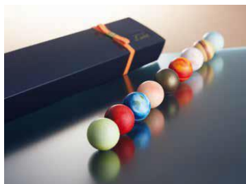
＜ショコラビティック レクラ＞ 太陽系チョコ懐石(9個入)