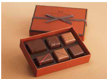
＜ラ・メゾン・デュ・ショコラ＞ アタクション(6個入)