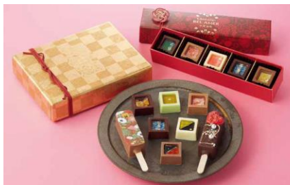
＜ベル アメル 京都別邸＞ スティックショコラアソート(8個入)