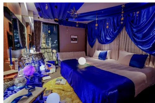
▲Royal Blue Room イメージ