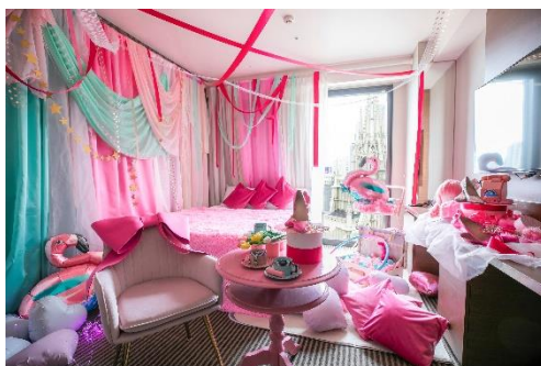
▲Pinky Pink Room イメージ