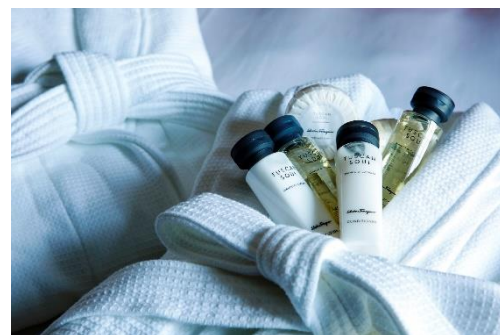
▲フェラガモアメニティ イメージ