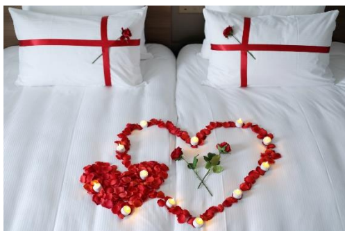
▲オプション記念日デコレーション イメージ