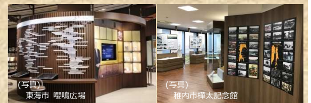
(写真) 東海市 嚶鳴広場