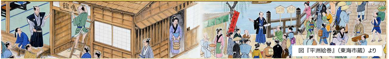
図『平洲絵巻』(東海市蔵)より

未曾有の人口減少、少子高齢化が進むなか、国全体では、郷土教育・ふるさと学習に見られる地域の価値探しの動きや、インバウンド消費に代表される観光流動が活発化しています。