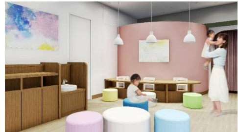
※ベビー休憩室イメージ

たまプラーザ店はコロナ禍を経て変化した新たな価値観に対応し、地域のお客さまがさらに日常生活を楽しめる提案を行うことと、ファミリーで過ごす場になることを目指し、段階的に改装を実施してまいりました。