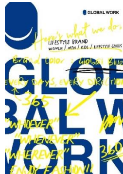
※<グローバルワーク>イメージ