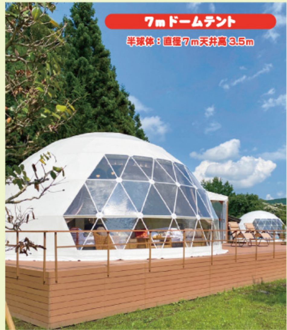
7mドームテント 半球体：直径7m天井高3.5m

TOKYO interior のデザイナーによる 15種類のテーマに基づいた家具をチョイス！ 大小4種類のドームテントにシングル4台タイプ12部屋 セミダブル2台タイプ6部屋をご用意しました。