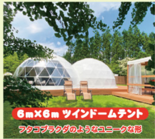
6m×6m ツインドームテント フタコブラクダのようなユニークな形