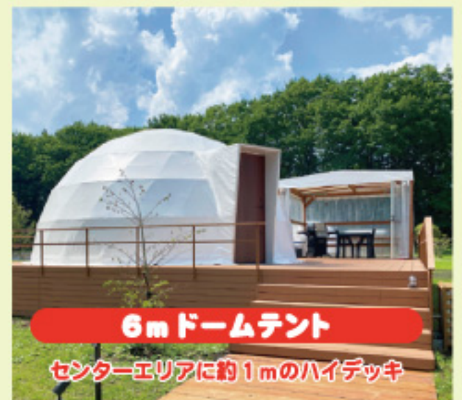
6mドームテント センターエリアに約1mのハイデッキ