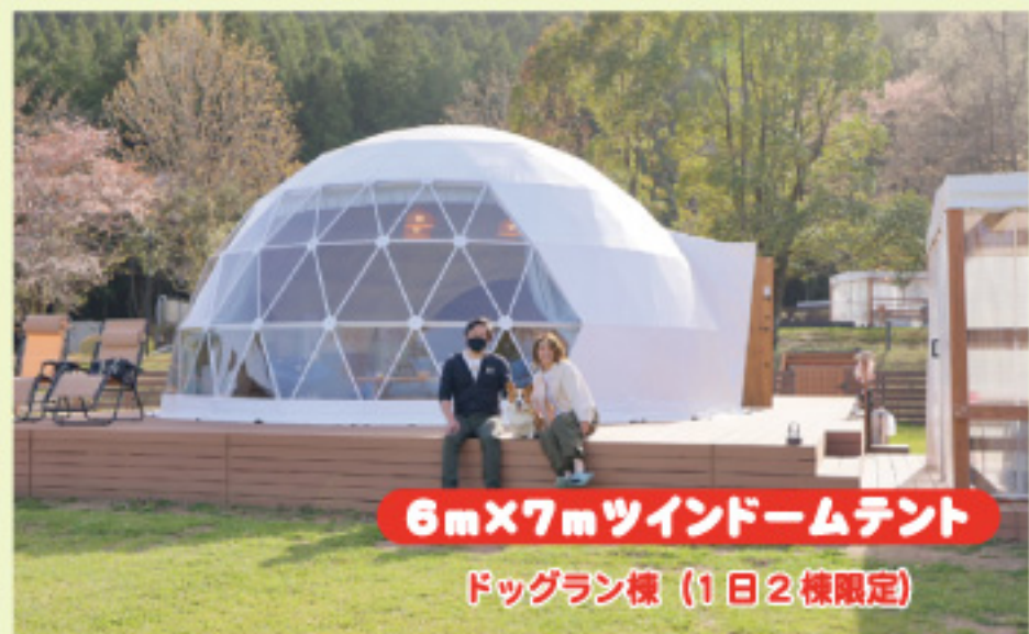
6m×7m ツインドームテント ドッグラン様 (1日2棟限定)