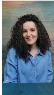
21-0347 カタリーナ・ボギチェヴィッチ (セルビア)