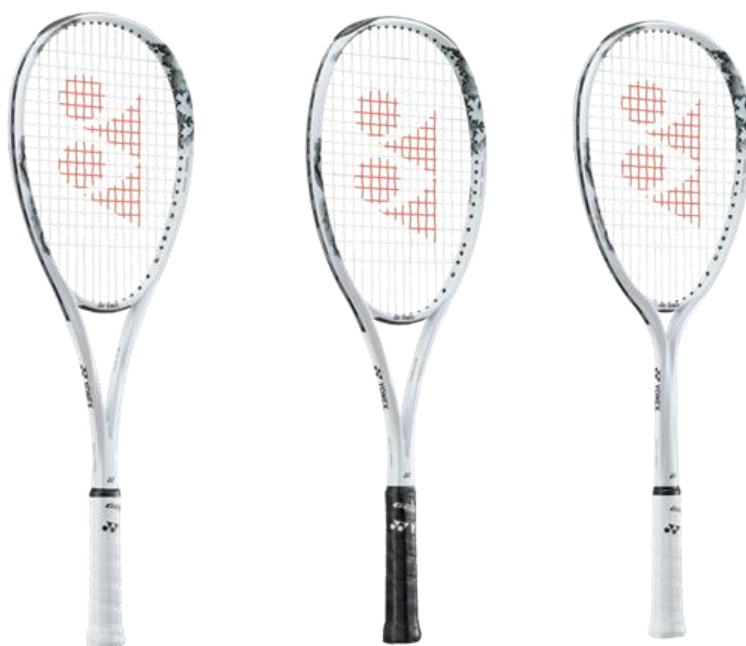
左から「NEW GEOREALANCE 80S」「NEW GEOREALANCE 80V」「NEW GEOREALANCE 80G」