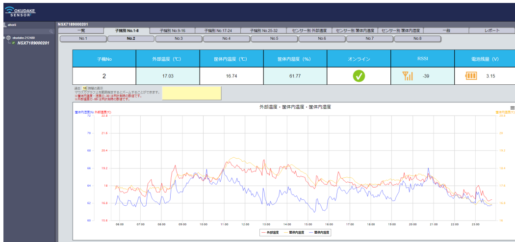
ダッシュボード表示画面例