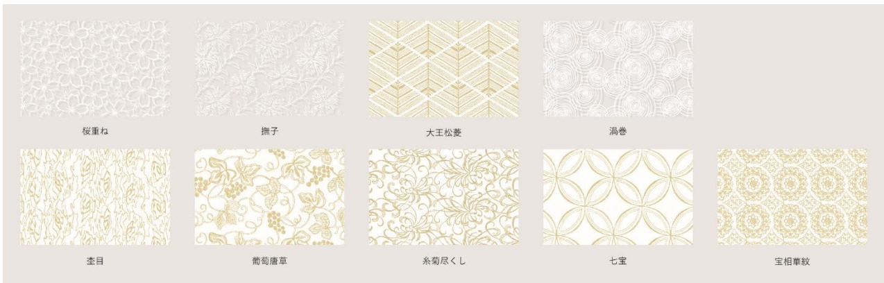
座席仕切りデザインのイメージ