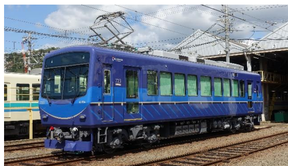
2020年にリニューアルした723号車