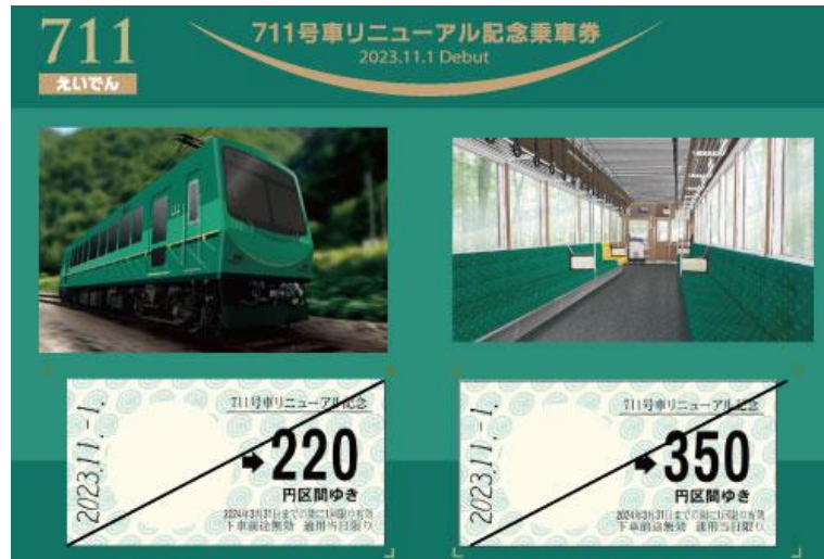
「711号車リニューアル記念乗車券」のイメージ (イラストの部分は写真となる予定です。)