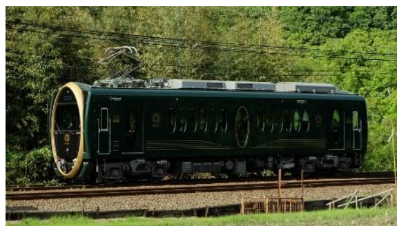
732号車 観光列車「ひえい」