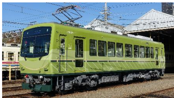
2022年にリニューアルした712号車