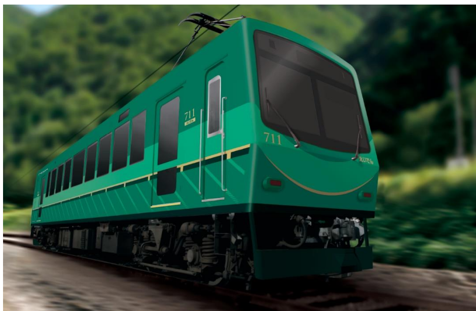
711号車リニューアルのイメージ