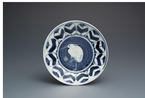
「初期伊万里 鷺矢羽根文皿」

会期 6月29日(木)～7月5日(水) ※最終日は17時閉場 内容 古来より大切に伝えられてきた陶磁器を中心に、生活を彩る古伊万里の食器から近世・近代の作家の逸品まで幅広い作品、約50点を展示販売いたします。