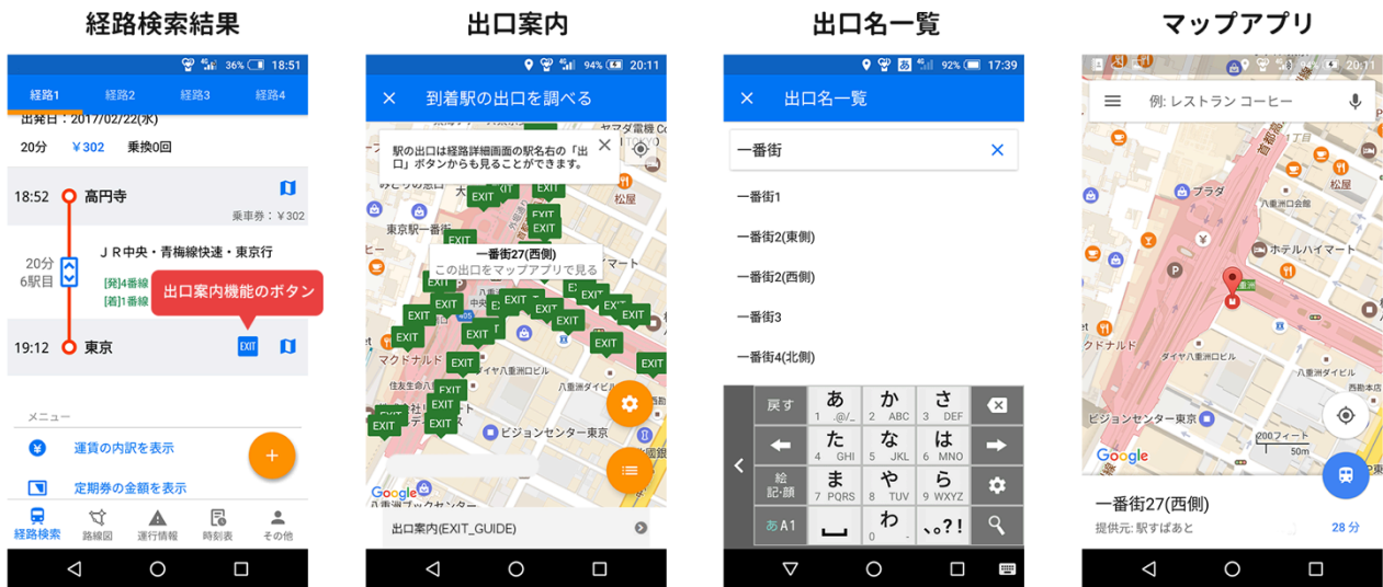
※画面は開発中のものです。

出口案内機能は、「駅すばあと for iPhone」では ver. 3.14.0 から、「駅すばあと for Android」では ver. 3.6.0 から利用できます。