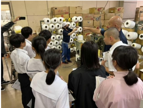
▲ ヤマヨテクスタイルでの授業風景

本プロジェクトは、和歌山県西牟婁郡すさみ町及び白浜町の中学生を対象とする実証事業「南紀熊野 AI デザイン部」のカリキュラムの一環として実施します。