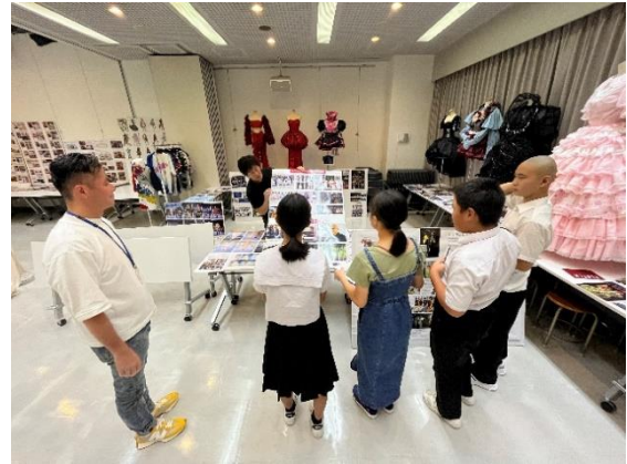
▲ 上田安子服飾専門学校での授業風景