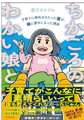
『ちかごろのわかい娘と』(帯あり)

株式会社オレンジページ(東京都港区)は、小社として初めて note 主催「創作大賞」※を授与した、実録系マンガ家・西アズナブルによるコミックエッセイ『ちかごろのわかい娘と 子育てに興味ゼロだった僕が、娘に夢中になった理由』を2月20日(金)に刊行しました。「もともと子育てには興味がなかった」著者が、初育児で我が子のかわいさに圧倒され365日連続でイラストを投稿、その勢いで本作をスタート。育児あるあるからお出かけスポット体験まで、リアルな日常を綴った作品です。 ※日本最大級の創作コンテスト(2023年の応募総数は33,981作品)