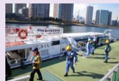
訓練の様子(さくら)

水上バス「さくら」、「あじさい」、「こすもす」は、通常時は隅田川等を運航しています。しかし、大規模災害が東京で発生した場合には、東京都の定める地域防災計画に基づき、防災船として救援物資、医療救護班及び患者、帰宅困難者等の移送を担う重要な役割を持っています。