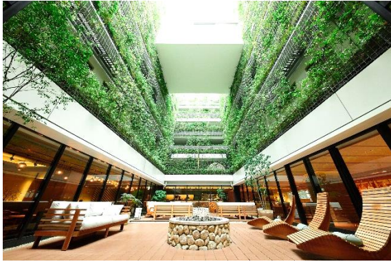
GOOD NATURE HOTEL