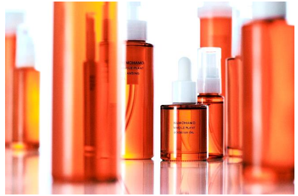
オーガニックコスメ NEMOHAMO