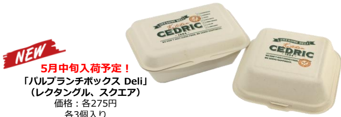
NEW 5月中旬入荷予定！ 「バルランチボックス Deli」 （レクタングル、スクエア） 価格：各275円 各3個入り