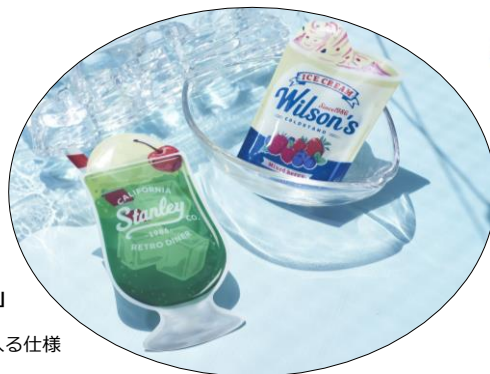
NEW 「保冷剤」 (Cream Soda, Ice Cream) 価格：各165円