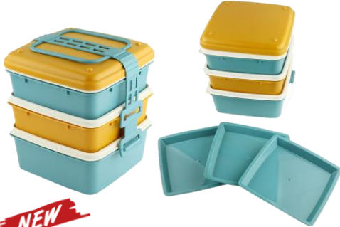
NEW 「ピクニックランチボックス イエローブルー」 価格：1,408円 サイズ：W17.5×D16.5×H18cm 容量：上中段1050ml、下段1300ml

ピクニックアイテムの定番、お弁当用の大きなランチボックスは新色にてリニューアル！取り分け用のトレイが3つ付いている、小技の効いたアイテムです。また、新作のバルランチボックスも使い捨てに便利など、ピクニックやアウトドアにもおすすめのアイテムをご紹介します。