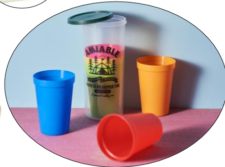
「ドリンクカップ 6P Amiable」 価格：209円 サイズ：Φ6.8×H9.2cm 容量：約150ml 6個入り