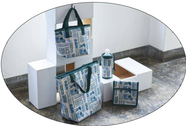
NEW 「保冷バッグ Farm S」 価格：385円 耐荷重：2kg

好評の保冷バッグシリーズに今年も新柄が登場です！オーガニックの自家菜園をテーマにしたデザインはユニセックスにお使いいただけるアイテムとなっています。保冷バッグ・ランチバック・ボトルホルダーと全4種類、新柄の保冷剤と合わせて、ぜひ揃えてお使いください！