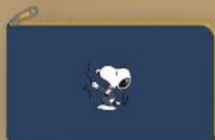
ポケット マルチポーチ W215×H120mm ¥1,800(税込)