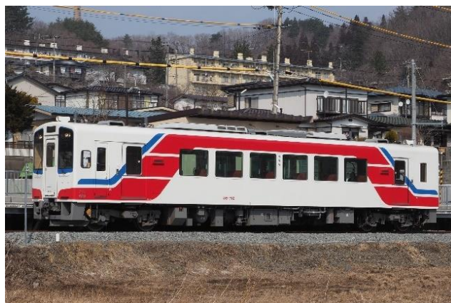
今回塗装する「三陸鉄道カラー」のイメージとなる三陸鉄道36-700形車両