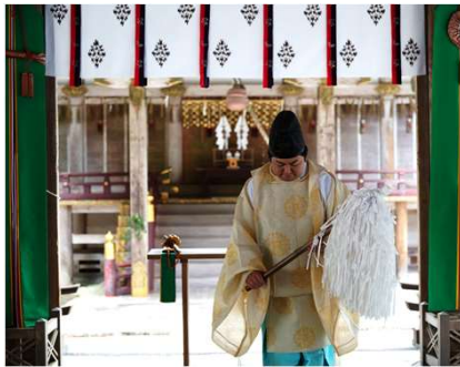
日吉大社での厄払い

西本宮を後にして、日吉大社の敷地内を散策します。もう一つの国宝社殿「東本宮」を含めた7つの社が桜や紅葉の美しい木々と融和した魅力的な境内です。一番の見どころは「山王鳥居」。鳥居の上部に三角形の破風（屋根）が乗っており、お寺と神社、仏と神が共存する比叡山の特徴的な信仰を表しています。