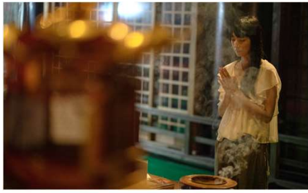
延暦寺での朝のお勤め