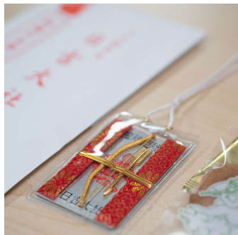
日吉大社のお下がり