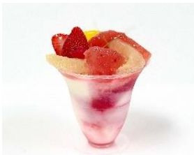
<柿の木坂キャトル> ヨーグル 550円

ヨーグルトムースとフランボワーズソースにグレープフルーツや苺などフレッシュなフルーツをトッピング。