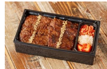
＜キンタン インザハウス＞ 「黒毛和牛上カルビ弁当」 2,280円 和牛カルビの中でもジューシーなタテバラ、カイノミ、ササミをたっぷり 120g 使用しました。ご飯が進む THE 焼肉弁当。