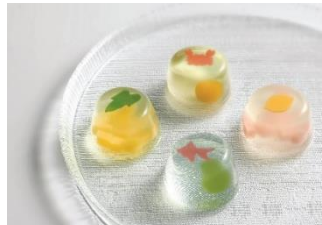
<笹屋伊織> 涼の晴風（4個入） 1,080円