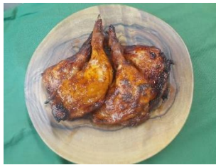
＜麻布あさひ＞ 「BBQチキン」 735円 「みちのく清流どり」の骨付きもも肉を BBQ 風の味付けで焼きました。豪快にかぶりついてお召し上がりください。 販売期間：8月28日（月）まで