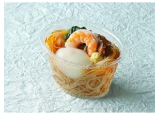
＜なだ万厨房＞ 「素麺温玉寄せ」 567円 暑い日にもものど越しよく味わえる、毎年好評の一品。 販売期間：8月中旬まで