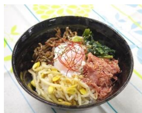
＜千駄木腰塚＞ 「コンビーフビビンバ」 1,080円 自家製コンビーフと温泉卵のとろけるベストマッチ。ナムルと一緒によくかき混ぜると更に絶品です。 ※水曜日のみ販売なし