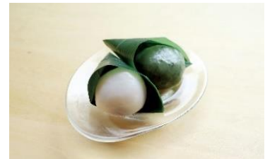
<銀座あけぼの> 水大福 249円