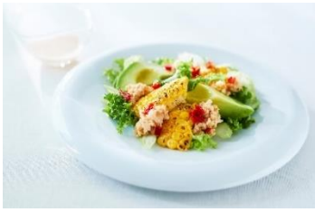
＜RF1＞ 「ゴールドラッシュ種」使用 「グリルコーンとアボカドのサラダ」 594円（100g） コリアンダー、クミン、ヌクナムなどのエスニックな味わいに、ライムの酸味がアクセント。 販売期間：7月6日（木）～8月9日（水）