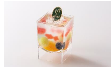
<新宿高野> フルーツアクア 540円

ラムネ風味と希少糖のジュレ（希少糖約0.7%配合）に果実と金魚の形の苺ジュレを閉じ込めた爽やかな味わいのデザート。