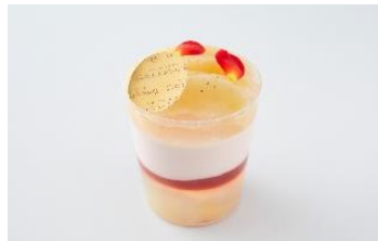
<ガトー・ド・ボワイヤージュ> 桃のムースゼリー 648円

優しく桃を感じる滑らかなムースと酸味の効いたラズベリーソースがアクセントに入った桃の果肉入りのさっぱりとしたクリアゼリー。