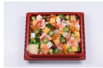
＜古市庵＞ 「夏ばら寿司」 627円 みょうがやオクラ、海老、穴子などが入った、暑い夏にさっぱりと食べられるちらし寿司。 販売期間：8月中旬まで