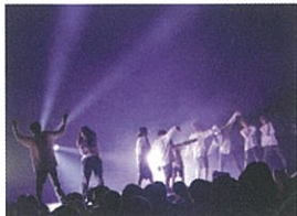
ハッピータイム ダンススタジオでレッスンに動んでいる子供達の選抜チームが出演。