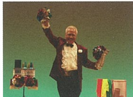
神々クラブ 熟練のマジック同好会メンバー 4 名による本格派マジックショー