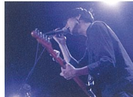
アカペラ、ギター演奏など 近畿大学の学生たちによる歌や演奏を本格コーヒーと共に。