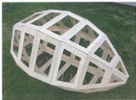
切り絵で飾る巨大ラグビーボール 巨大ラグビーボールに切り絵を作って飾ろう。対象:小学校高学年以上