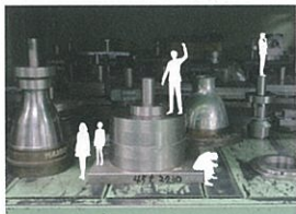
金型ジオラマワールド 工場の金型保管棚を利用した近畿大学学生作品のジオラマワールド。