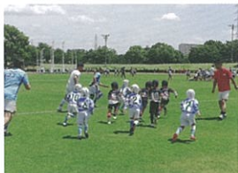
東大阪KINDAIクラブラグビースクール 子供も父兄もコーチも楽しい! 小さなお子様向けの面白ラグビー教室の練習を体験しよう。