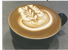
Coffee Base KANONDO 店頭焙煎の新鮮な豆を使用したスペシャルティコーヒー。ラテアートパスタ来場。