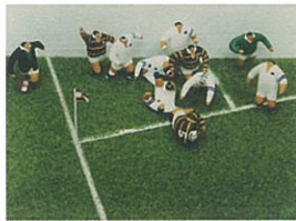
ラグビー場を作ろう!! 選手や観客を作りラグビー場を再現しよう。対象:小学生以上