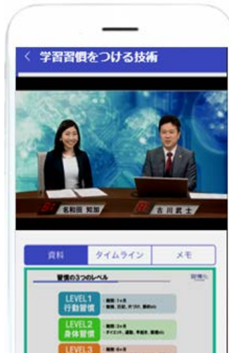
スマートフォンでの受講イメージ①

グローバル環境で活躍できる人材の育成を目的として1998年に世界的経営コンサルタント大前研一により設立された教育会社。設立当初から革新的な遠隔教育システムによる双方向性を確保した質の高い教育の提供を目指し、多様な配信メディアを通じてマネジメント教育プログラムを提供。大学、大学院、起業家養成プログラム、ビジネス英語や経営者のための勉強会等多様な教育プログラムを運営するほか、法人研修の提供やTV番組の制作など様々な顔を持つ。2013年10月のアオバジャパン・インターナショナルスクールへの経営参加を契機に、生涯の学習をサポートするプラットフォーム構築をグループ戦略の柱の1つとして明確に位置づけている。在籍会員数約1万人、輩出人数は約5万人以上。 http://www.bbt757.com/