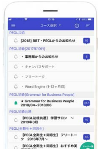
スマートフォンでの受講イメージ②