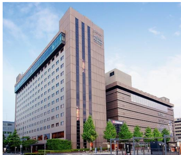
ホテル京阪 京都 グランデ

https://www.hotelkeihan.co.jp/new_normal/