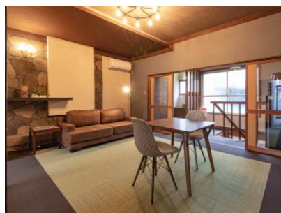
カフェ 2F コワーキングスペース