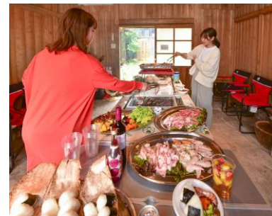
全天候対応 BBQ ハウス