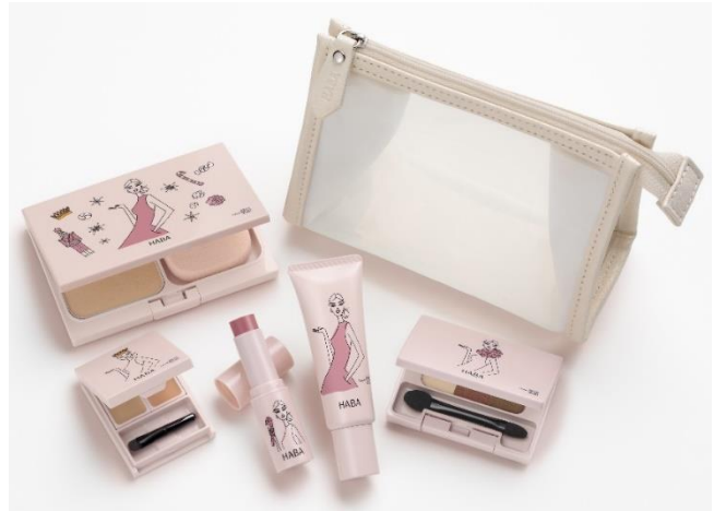
『ウインターストーリーコレクション』 7,480 円(税込)