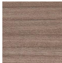
RW4062 グレーウォルナット