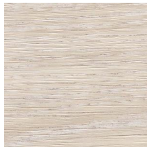
TC4359 チョークドオーク

特殊な印刷技術と緻密なエンボス加工で木目やレザーなどの素材のリアルな風合いを追求した(株)サンゲツの『REATEC』を『risora』に貼り付けることで、エアコンに陰影を持った深みのある表情を創出します。ナチュラルで健康的な空間づくりができる自然素材を再現した「グレーウォルナット」と「花染」を新たにラインアップ。自分らしく個性的な空間をつくるレザー、大理石、和紙など合計10種類のラインアップで過ごしたい空間づくりを実現します。