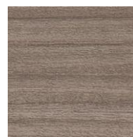
「グレーウォルナット」