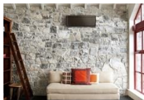
ウォルナットブラウン