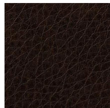
TC4515 レザー(ヴィンテージ)