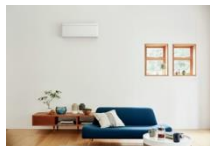
ファブリックホワイト