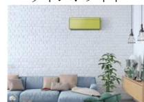
オリーブグリーン