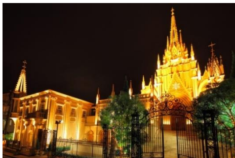
輝く青山セントグレース大聖堂外観

また社会情勢により、営業時間変更等を実施する場合がございます。営業情報に関しては、各店の公式ホームページをご確認ください。