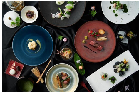
ディナーコースイメージ