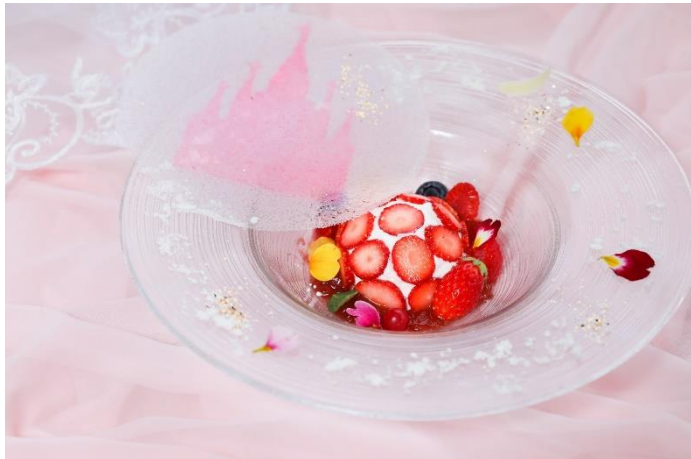
▲セントグレースストロベリーショート

まるでお城のような外観の大聖堂を店内の全席から臨むことができる『restaurant VINO BOUNO(レストラン ヴィーノブーノ) 青山／セントグレース大聖堂』。ランチタイムは自然光の差し込む明るい雰囲気、ディナータイムはライトアップされた光り輝く大聖堂を前に大人びたムードへと変化します。とびきりロマンティックな雰囲気の中で、日頃頑張る自分へのご褒美ランチに、大切な友人と集うサプライズたっぷりの女子会やママ会に、ご夫婦やカップルの記念日ディナーにと、幅広いシーンでご利用いただけるレストランです。