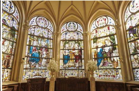
大聖堂内のステンドグラス(結婚式以外では非公開)