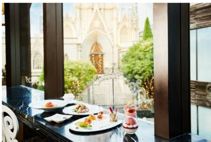
▲青山セントグレース大聖堂を眺めながらのランチイメージ

オープン記念の第一弾として、大聖堂をイメージしたデザートを2022年4月より2か月間限定で販売いたします。