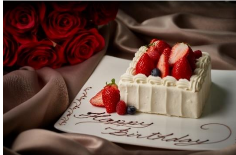
アニバーサリーケーキにはメッセージも可能