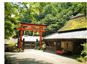
新緑の嵐山(左)と嵯峨鳥居本(右)