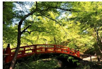
青紅葉の北野天満宮「もみじ苑」