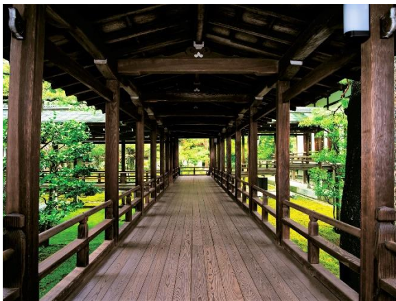
大覚寺「村雨の廊下」

観光のお客さまはもちろん、京都市内など近隣の皆さまも、街なかの混雑から少し離れ、嵐電沿線のみずみずしい新緑で心とからだをリフレッシュしてみませんか。