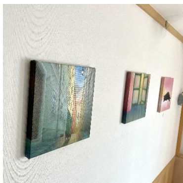
客室内がギャラリーに(左面壁)