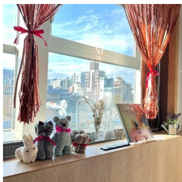
絵本をテーマにしたタオルアートも