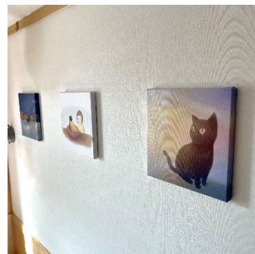
客室内がギャラリーに(右面壁)