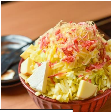
『もんじゃ』の昼食(イメージ)