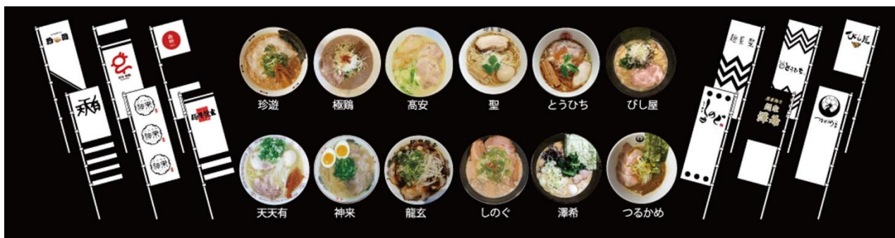
「熱々キャンペーン」に参加する各店舗のラーメン