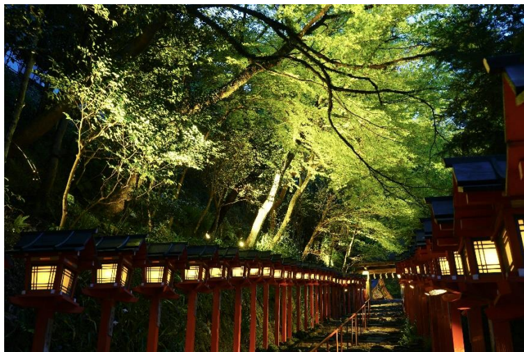
過去開催時の様子