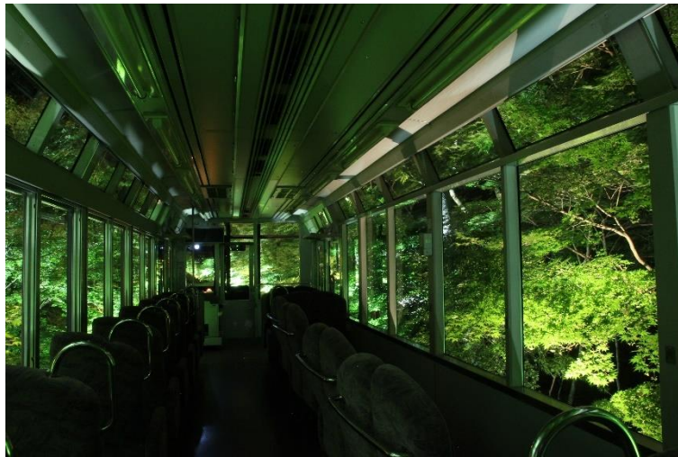
「青もみじ新緑のライトアップ」過去開催時の様子