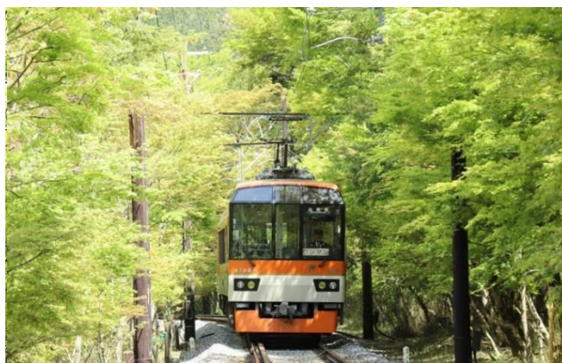
新緑のもみじのトンネルを走る展望列車「きらら」