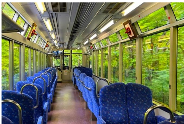
「もみじのトンネル」車窓からの風景