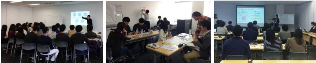
※昨年のインターン風景