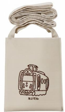
サコッシュのイメージ