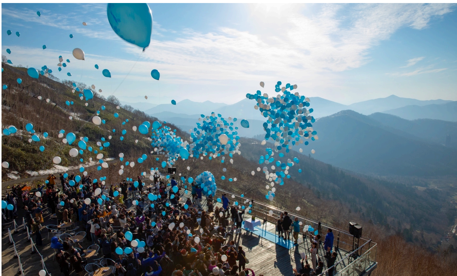
*この画像は2018年のオープニングセレモニーの様子です。

北海道最大級の滞在型リゾート「星野リゾート トナム」は、2019年の「雲海テラス」の営業開始日である5月11日に、オープニングセレモニーを開催します。これは、お客様と一緒にバルーンリリースとシャンパンオープンを行うセレモニーです。「今年もたくさんの方が雲海に出会えますように」という願いを込めて、バルーンリリースを行います。シャンパンオープンは立ち昇る泡の様に、今年も雲海がたくさん発生して欲しいという「豊雲」の願いを込めて行われます。加えて今年は、雲海テラスに向かう際に乗車するゴンドラに新たに登場する、雲がデザインされた「雲ゴンドラ」のお披露目もします。