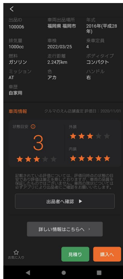
【クルマの状態目安】

当サービスの名称は、中古車の売買を行うお客様同士の「縁」を紡ぎ、C to Cプラットフォームを通じてみんながつながる「円」、クルマのテーマパーク「園」になる、という思いを込めて「クルマのえん」と名付けました。「クルマのえん」は売り手と買い手を繋ぐ安心・安全なプラットフォームとして、中古車の個人間売買をサポートします。