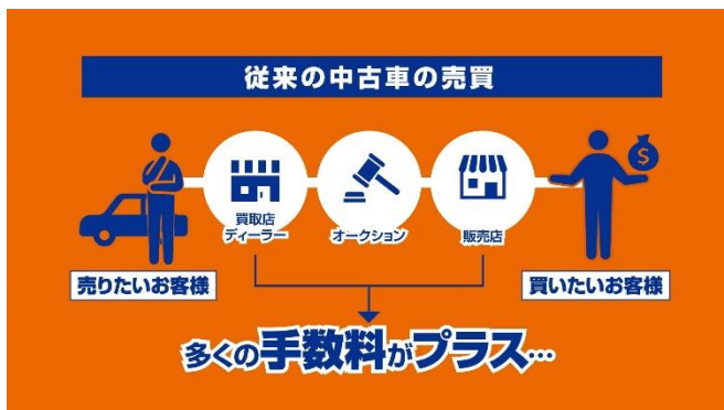
【従来の中古車売買サービスイメージ図】