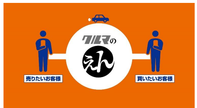
【「クルマのえん」の中古車売買サービスイメージ図】