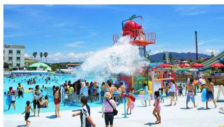
ジャブリンタウン

リンゴのジャブリンから放たれる約1トンもの水しぶき。いろんなしかけを見つけてみよう。