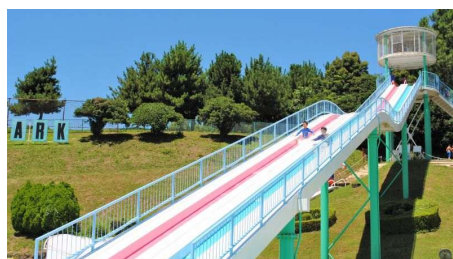
ジャンボスライダー