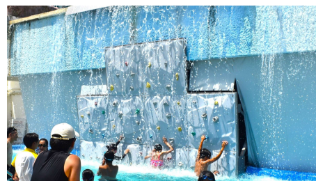
キッズボルダリング