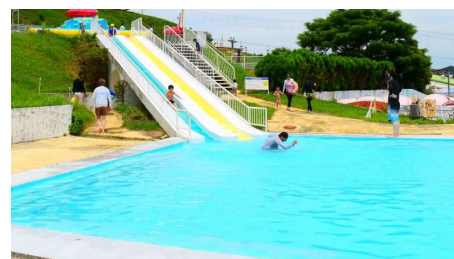
ジュニアスライダー