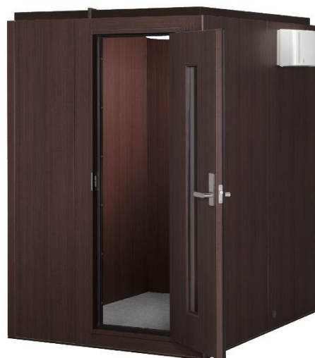
ヤマハ防音室「マイルームⅡ」1.5畳