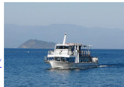
いんたーらーけん