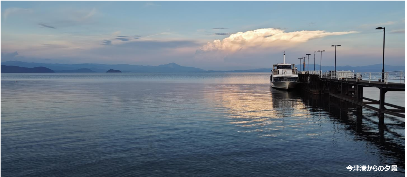
今津港からの夕景

琵琶湖汽船株式会社（本社：滋賀県大津市浜大津、社長：川添 智史）では、今津港開港 50 周年を記念し 2024 年 9 月 14 日（土）と 9 月 21 日（土）の 2 日間限定で「今津港開港 50 周年記念サンセットクルーズ」を運航いたします。