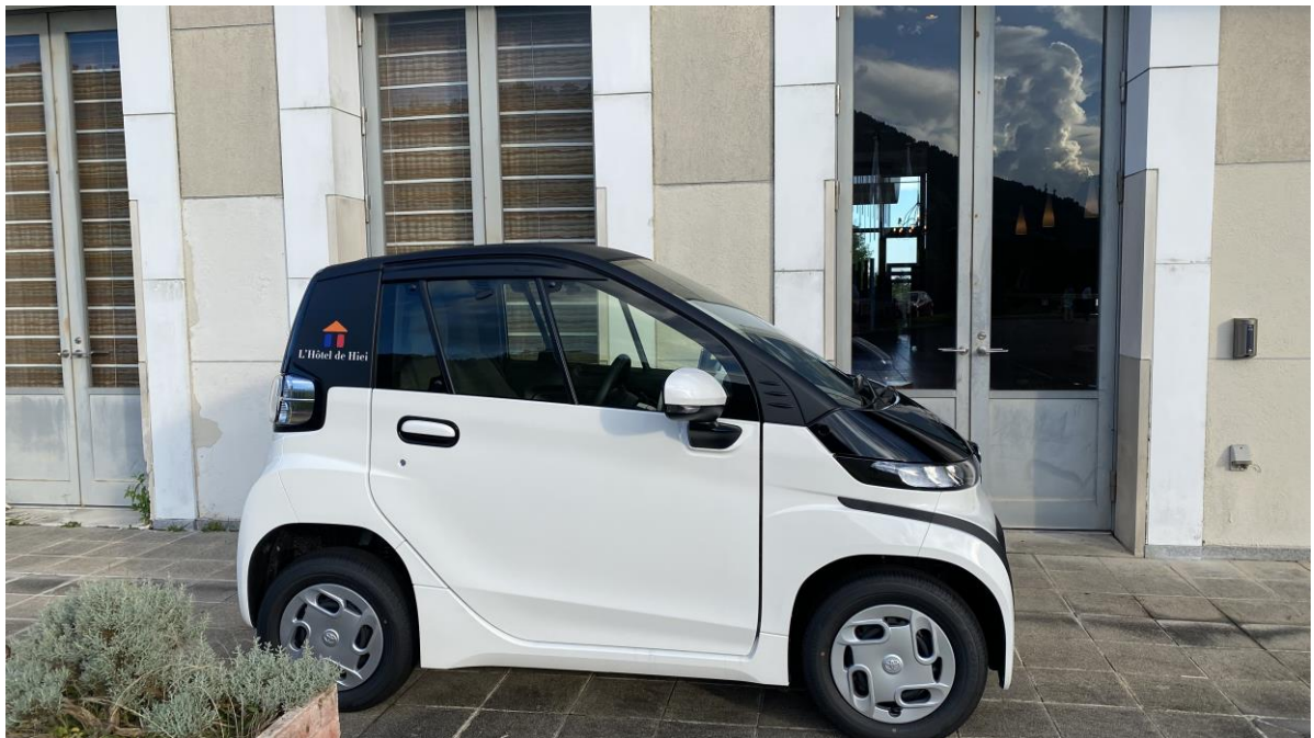
トヨタ超小型BEVの電気自動車「C+pod」 ロテルド比叡専用車

世界文化遺産に登録されている比叡山延暦寺や、花々が咲き誇る比叡山山頂の庭園、ガーデンミュージアム比叡など、比叡山内には観光地がたくさんあります。比叡山中腹に位置するロテルド比叡から山内のドライブウェイを走り、自然を満喫いただきながらドライブをお楽しみください。