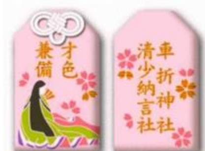
「清少納言社」の「才色兼備お守り」