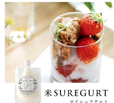
米 SUREGURT マイシュワグルト