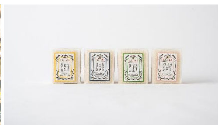
オリジナルにパッケージングしたお米