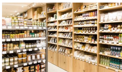
店内には 250 種のごはんのお供が並ぶ