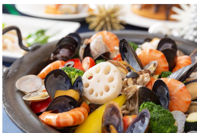
クリスマスディナービュッフェ料理(イメージ)