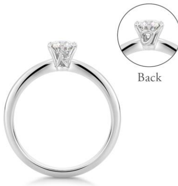
イニシャル2つを選び、両側にデザイン

ケイ・ウノはオーダーメイドの文化を広げるため、今後も新たなサービスを展開する予定です。