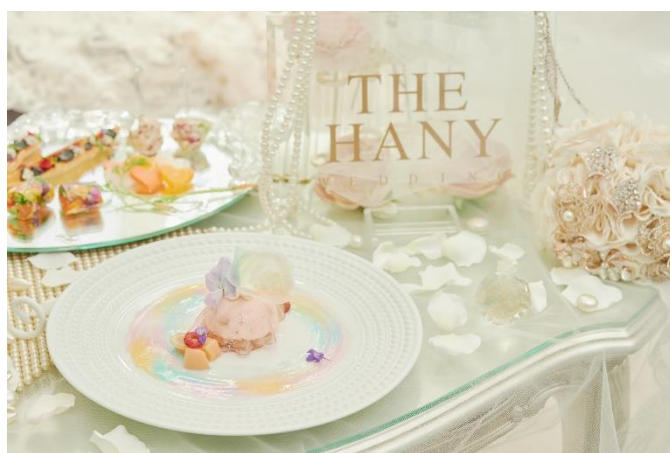
▲【左】イメージ 【右】美しいグラデーションカラーのアシェットデセール