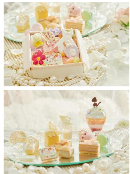
▲【左】イートイン アフタヌーンティーイメージ 【右】テイクアウト用アフタヌーンティースイーツイメージ(上)Premium(下) Standard

はじめに提供されるのは、美しいグラデーションカラーのアシェットデセール「~Rainbow bouquet~ 夢見るドレスに見立てたピーチメルバ」。優しい甘さのバニラクリームと桃のムースに、桃のコンポートと甘酸っぱいラズベリーを添えた、初夏にぴったりの軽いデザートを、「THE HANY」を代表するレインボードレスに見立てました。そのほか、パールやバタフライ、エンゲージリングなど“結婚”にまつわるモチーフを散りばめたパステルカラーのスイーツや、彩り鮮やかな軽食を、マリアージュフレールの香り高い紅茶とともにご堪能いただけます。