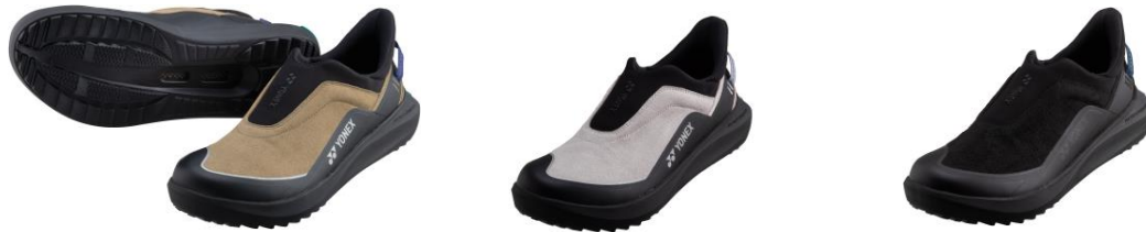
左からカーキ、サンドグレー、ブラック