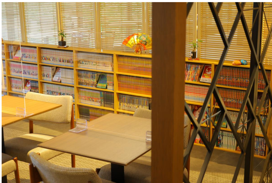
京都八条口 コミックカフェスペース

コミックカフェには、常時話題の新刊から懐かしいものまで約1,000冊のコミックをご用意しており、普段あまりマンガを読まない方でも思わず手にとりたくなるタイトルが並んでいます。電子書籍が主流になりつつある昨今、スマホを置いて長編作品に没頭してみてもいかがでしょうか。セルフドリンクバーも併設しており、ご宿泊のお客様には滞在中無料（営業時間内）でご利用いただけます。読み始めて続きが気になる時も時間が許す限り、気兼ねなく読み続けることもできます。またご宿泊以外のお客様も時間料金でご利用いただくことが可能です。