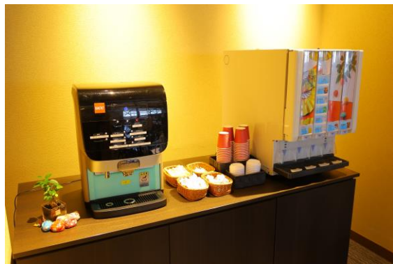
コミックスペース、セルフバー