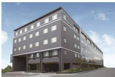
ホテル京阪 京都八条口